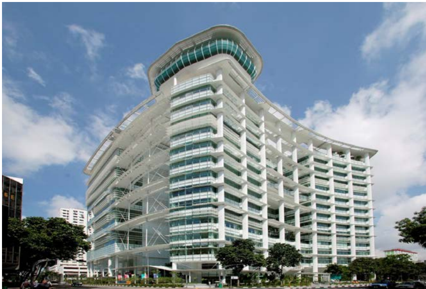
ภาพที่ 2 อาคารหอสมุดแห่งชาติสิงคโปร์หรือห้องสมุดลี กง เซียน